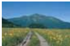
尾瀬 Oze 尾瀬 尾瀬 오제