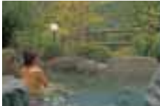
露天風呂 Outdoor Hot Springs 露天温泉 露天温泉 노천탕