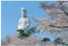
白衣観音 Byakui Kwannon 白衣观音 白衣觀音 바쿠이관음