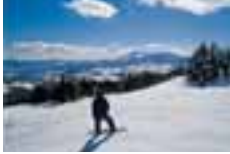
スキー Skiing 滑雪 滑雪 스키