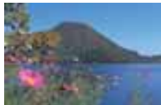
榛名山 Mt. Haruna 榛名山 榛名山 하루나산