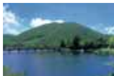
赤城山 Mt. Akagi 赤城山 赤城山 아카기산