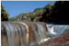
吹割の滝 the Fukiwari Falls 吹割瀑布 吹割瀑布 후키와레 폭포