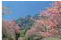
妙義山 Mt. Myogi 妙义山 妙義山 묘오기산

ぐんま観光マップは、英語と日本語で表記しています。 The Gunma Guide Map is written in both English and Japanese. 群馬观光地图使用的语言是英文和日文。 群馬觀光地圖使用的語言是英文和日文。 군마관광지도는 영어와 일본어로 표기되어 있습니다.