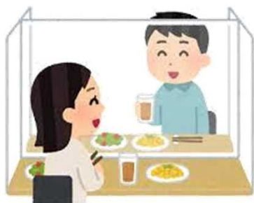
避免多人數聚餐 不使用同一盤子