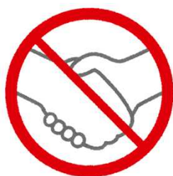
避免握手、擊掌、擁抱